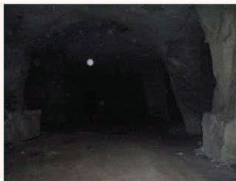
Photographie de la cavité