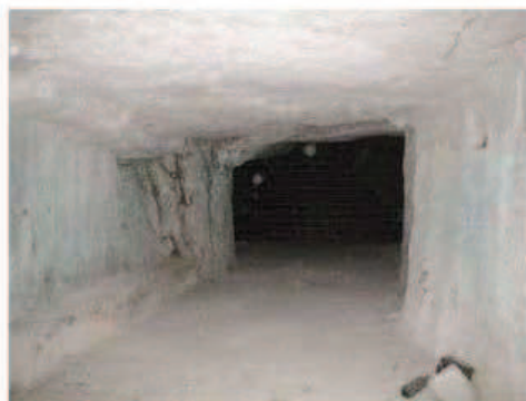
Photographie de la cavité