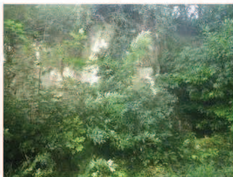
Photographie de la cavité