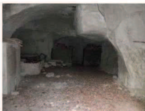
Photographie de la cavité