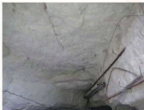
Photographie de la cavité