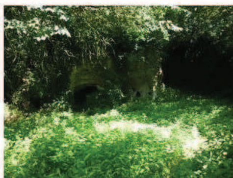
Photographie de la cavité