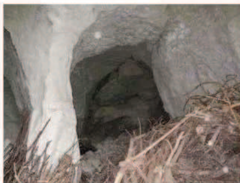
Photographie de la cavité