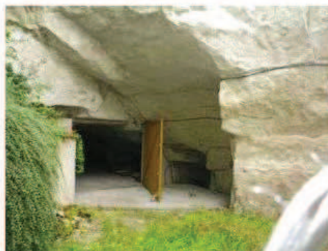
Photographie de la cavité