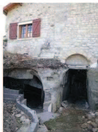
Photographie de la cavité